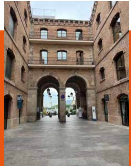
Der Gang durch die Altstadt führte zum Hafen

Werk von HOMAG España in Barcelona. Im Mittelpunkt standen die neuesten Generationen der liegenden Plattenaufteilsägen S-100 und S-200 sowie die Neuheit