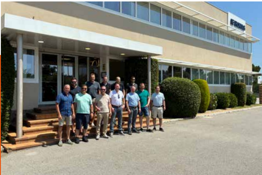
Gemeinsames Gruppenbild mit dem Team von HOMAG Schweiz AG sowie von EIGENMANN AG vor dem HOMAG Werk in Barcelona

Besichtigung HOMAG España: Vom 28. bis 30. Mai 2026 besuchte eine 5-köpfige Delegation unseres Teams gemeinsam mit Vertretern von HOMAG Schweiz AG das