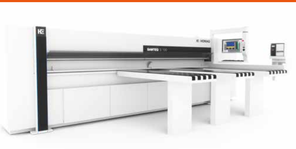
Liegende Plattenaufteilsäge HOMAG SAWTEQ S-100 - hergestellt im HOMAG Werk in Barcelona

S-190. Neben spannenden Einblicken in die Produktion kam auch der persönliche Austausch nicht zu kurz, u. a. bei einer Velotour, einem Segelwettbewerb und einem Rundgang durch die Altstadt. Den genussvollen Abschluss bildete ein gemeinsames Paella-Essen in einem schönen Strandrestaurant.