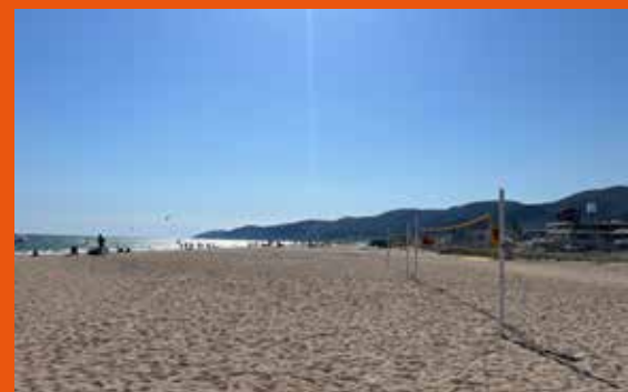
Eindrücke von der Umgebung vom Abendessen beim Strand