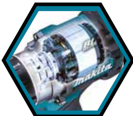
Bürstenloser, wartungsfreier und langlebiger Motor.