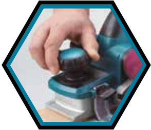
Einfache Tiefeneinstellung mit dem Rändelrad.