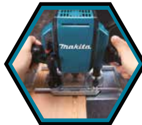
Gummiertes Griffsystem für komfortables Arbeiten.