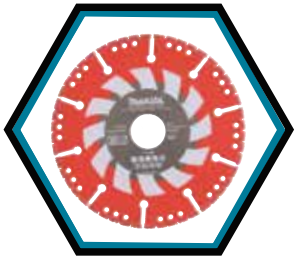
B-55310 - Diamanttrennscheibe RESCUECUT 125 mm