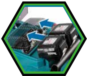
Die Akkus werden parallel in separaten Akku-Dockingstationen platziert.