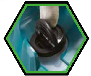
Grosse Öleinfüllöffnung mit Sichtfenster.