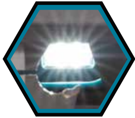
Doppelte LED-Beleuchtung mit Vor- und Nachbeleuchtungsfunktionen.