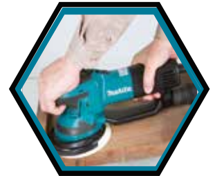
Ummantelter Handgriff sorgt für sicheren Halt und angenehmes Greifgefühl.