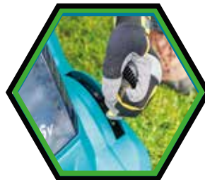
Leichte Höhenverstellung mit einem Griff.

Leerlaufdrehzahl : 3'600 U/min Schnittbreite : 43 cm Schnitthöhenverstellung : 20 - 75 mm Autonomie : 575 m 2 (2x BL1860B) Grasfangkorb : 40 L Gewicht ohne Akku : 15,07 kg