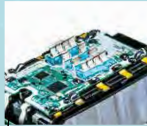
Struktur zur Verhinderung von Kurzschlüssen

Hohe Haltbarkeitsspezifikationen speziell für 40Vmax Li-Ionen Akkus.