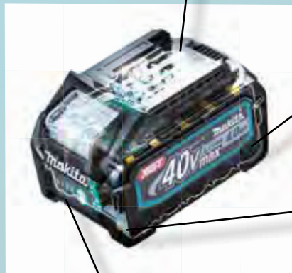
Struktur zur Stossdämpfung