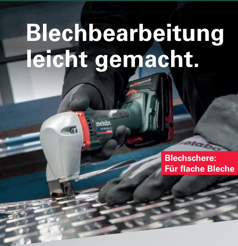
Blechscherer: Für flache Bleche