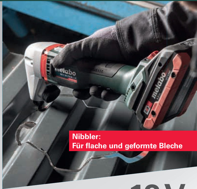
Nibbler: Für flache und geformte Bleche